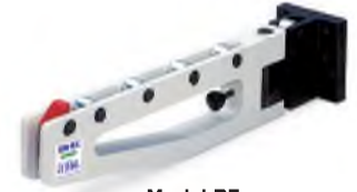
Model RF Katlamalı / Folding