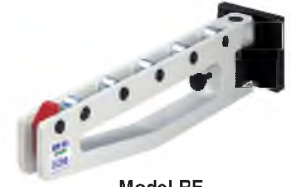
Model RE Katlamalı / Folding